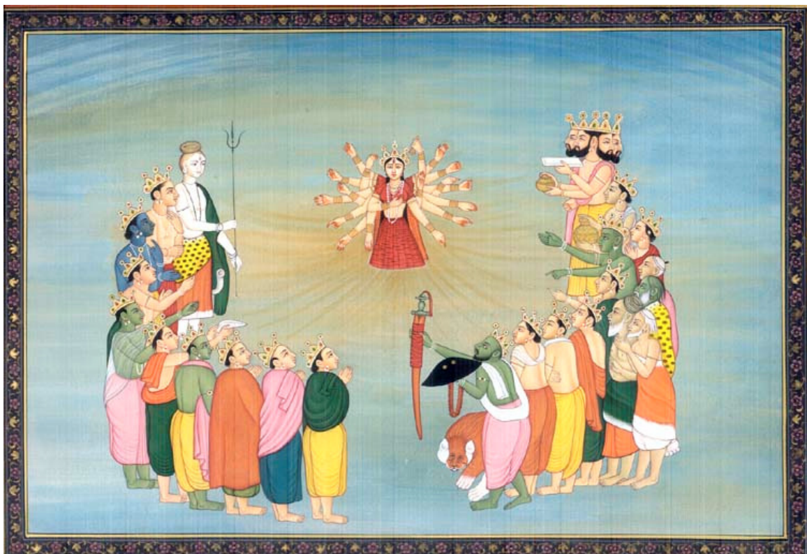
A criação da Deusa ( Devi )

" Devi Gita " significa "Cântico da Deusa". É um texto constituído pelos dez últimos capítulos da sétima parte ( Skandha ) do Devi Bhagavata Purana , escrito no século XI d.C. É uma obra que descreve a Grande Deusa indiana, incluindo aspectos devocionais e filosóficos. A maior ênfase do Devi Gita é, no entanto, devocional, enfatizando sempre a necessidade do amor pela Deusa, no caminho de desenvolvimento espiritual de homens e mulheres.